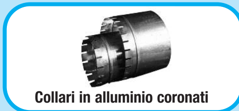
Collari in alluminio coronati