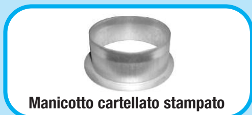
Manicotto cartellato stampato